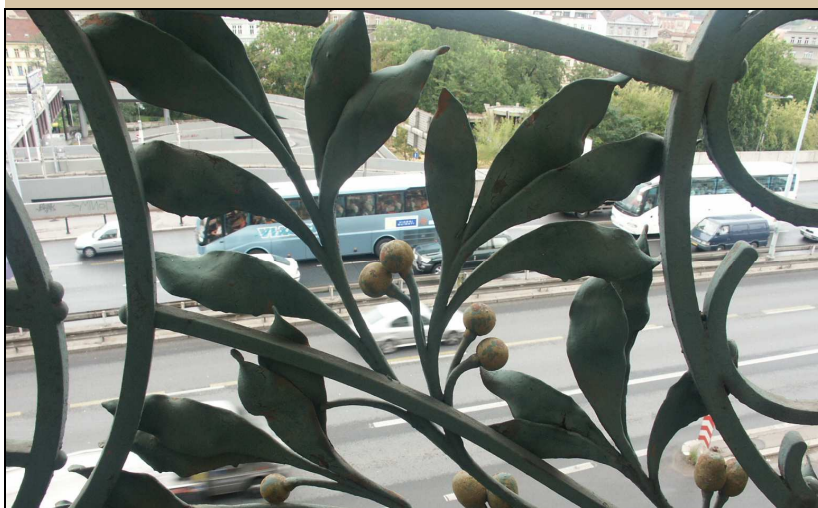
detail rostlinného motivu